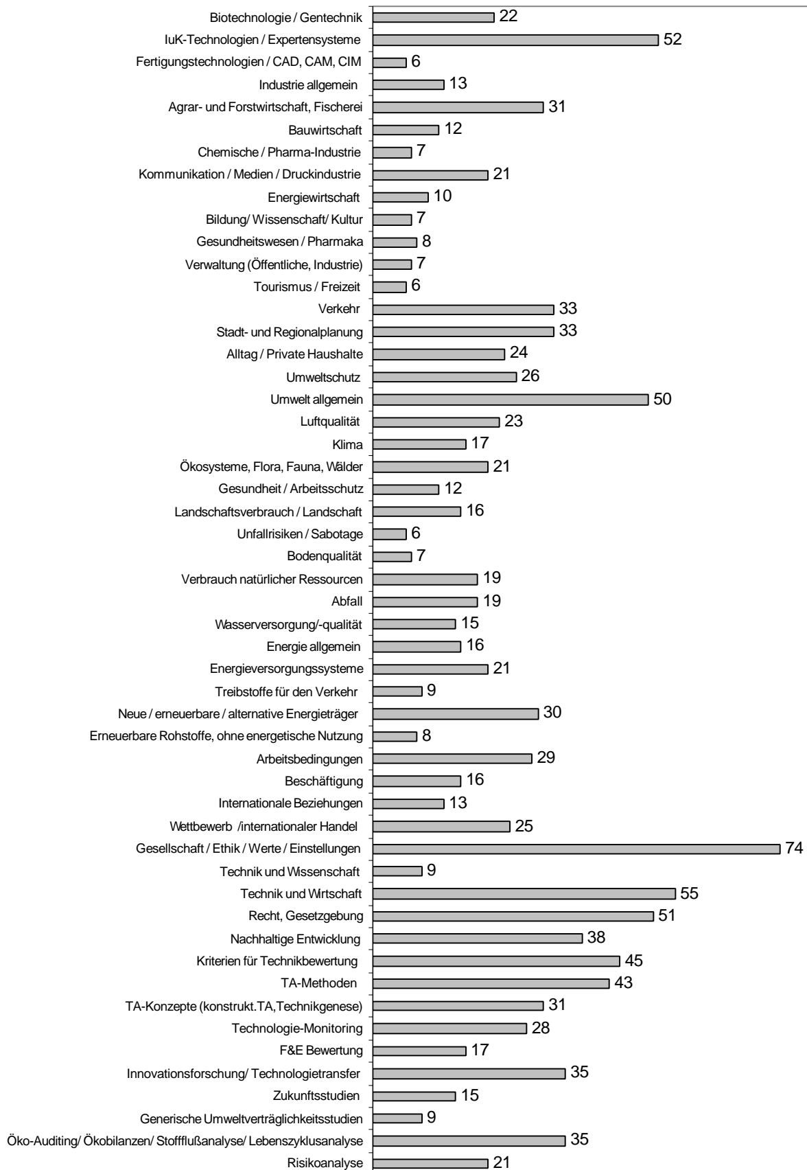
Abb. 3: Verteilung der neu erfaßten deutschen Projekte auf die Sachgebietsklassifikation (CC-Codes) mit mehr als 5 Nennungen